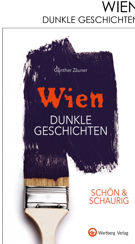
WIEN DUNKLE GESCHICHTEN