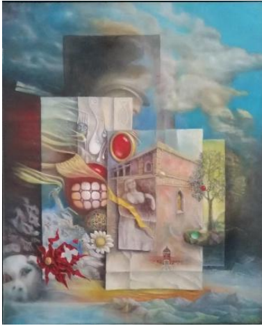
ES IST NICHT ALLES LANGE HER 2023