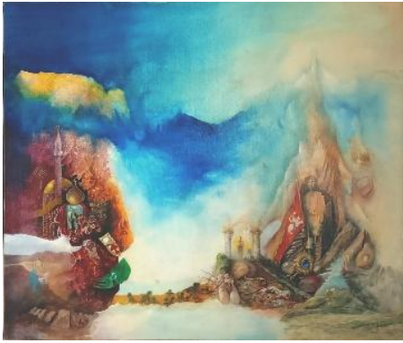
HISTORIA REPELLENSIS 2019-2023