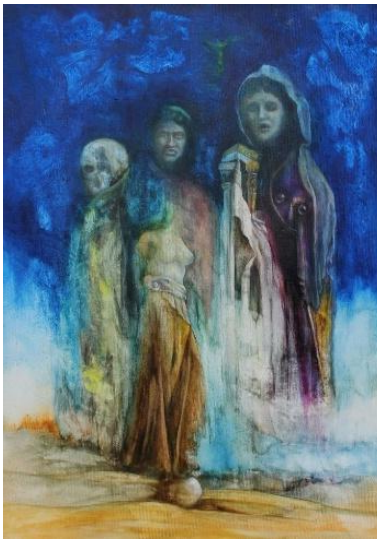
EROS E THANATHOS 2006