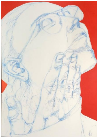
I-HRE ANSICHT-S-SACHE? 2025

Pastellstift, Acryl auf Leinwand 70x100 cm 1.140.-