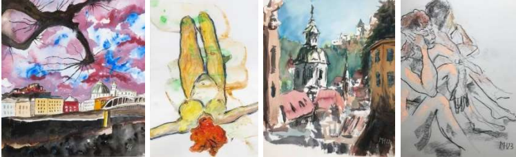
Bilder der Ausstellung

Tel. 0680.128.2380 office [at] galeriestudio38.at