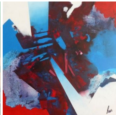
#15 CIAO BELLISSIMA