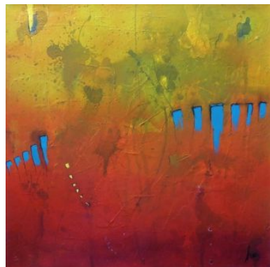
#1 GAPS BETWEEN WORDS