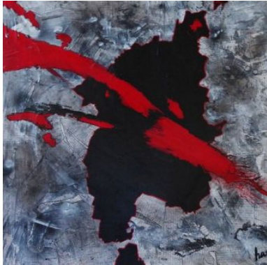
#10 LITTERA INCOGNITA #11 LONELY SOUL