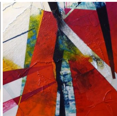
#18 DIE FERSE DES ACHILLES