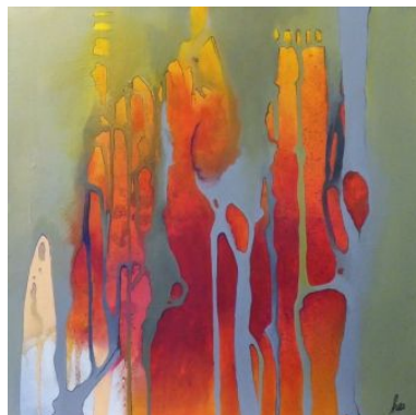
#8 TALES OF SOME FORGOTTEN DREAMS