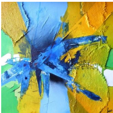
#16 NOTHING ELSE MATTERS