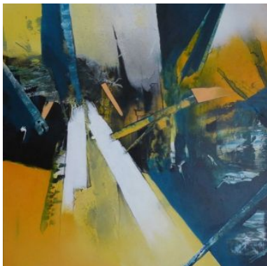
#13 THE ARTIST IS ALWAYS ALONE