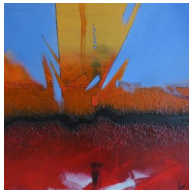
#9 UNTERGANG DER TITANIC