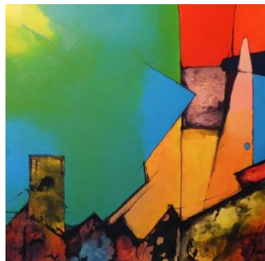
#7 HUNGER NACH UTOPIE