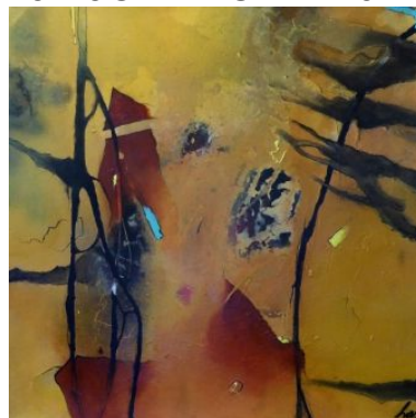
#3 AUGENBLICK DER STILLE